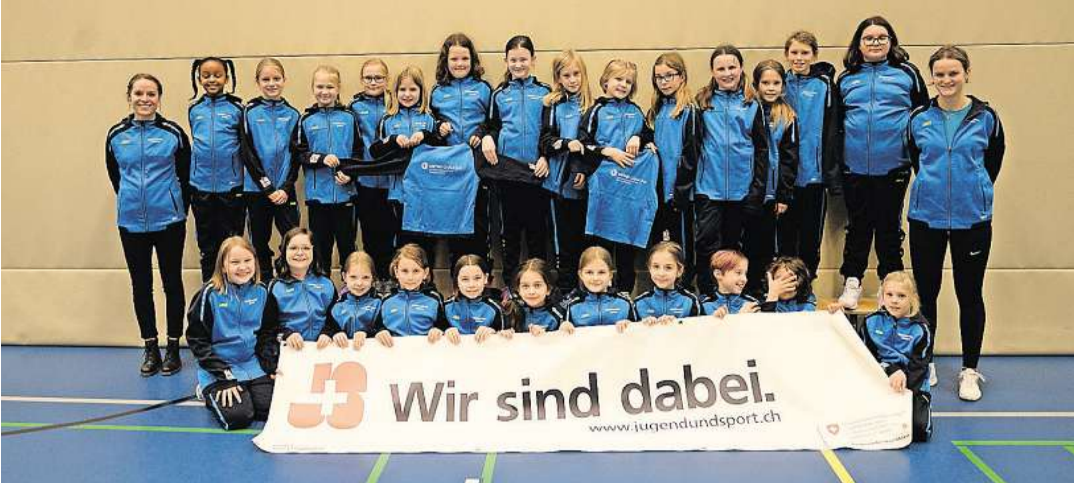
Die Freitagsgruppe trägt mit Stolz den neuen Trainingsanzug.