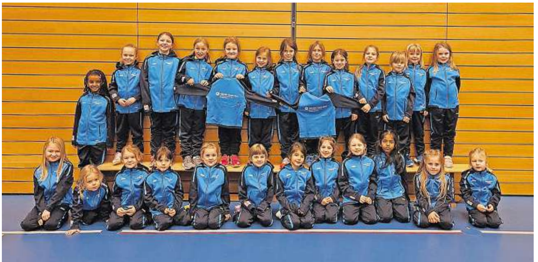
Die Montag- und die Kidsgruppe.

Ein riesengrosses Dankeschön an die Sponsoren Ortho, Cham/Zug, und Rigi-Sport, Küssnacht.